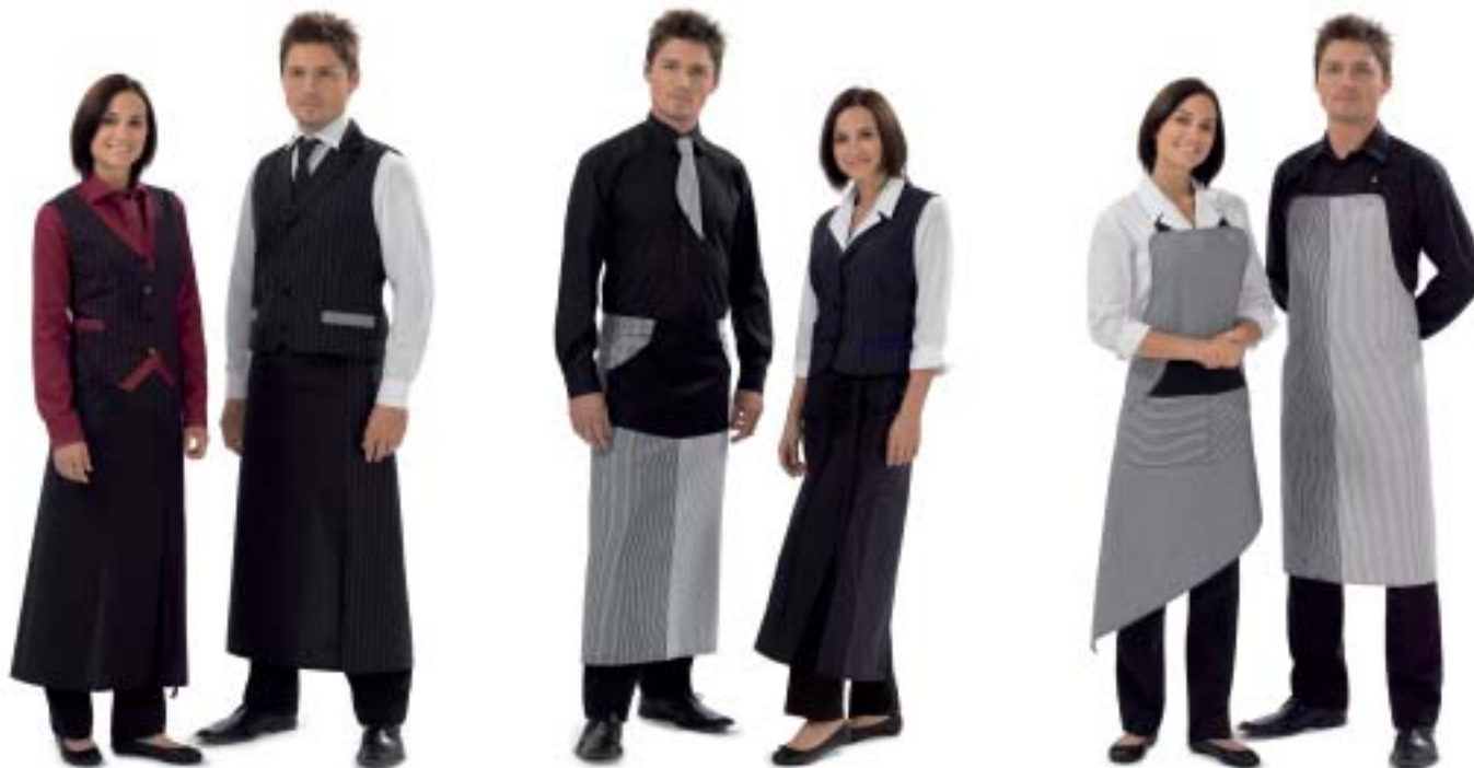
150C-003 Damengilet | Gilet Dame 160C-005 Bistroschürze 90/90cm Tablier Bistro 90/90cm 65% Polyester; 35%Baumwolle | 65% Polyester; 35% Coton