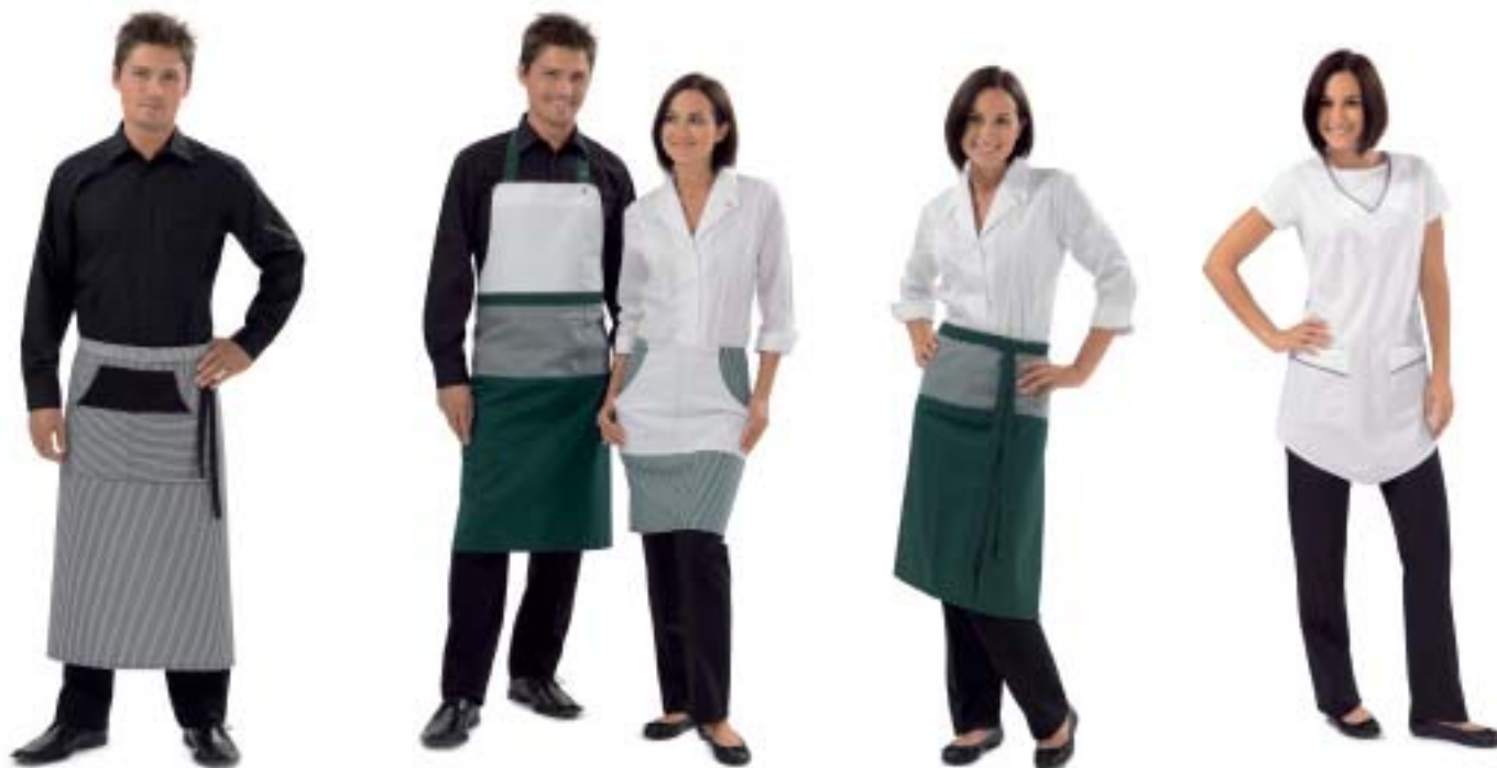
160C-008 Bistroschürze 90/90cm Tablier Bistro 90/90cm 65% Polyester; 35%Baumwolle 65% Polyester; 35% Coton