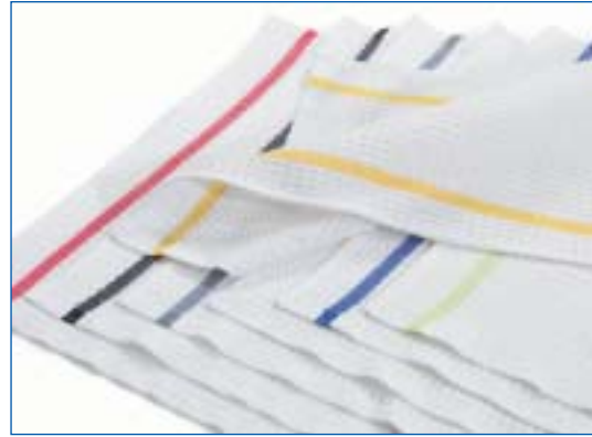
1501,0628 Spültuch weiss mit farbiger Bordüre Lavette blanc avec une bordure en couleur 100% Baumwolle, 100% Coton