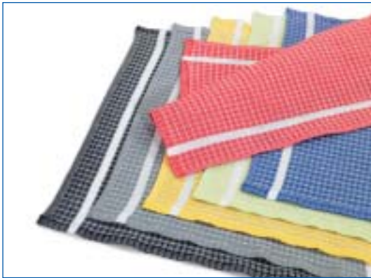
1501,0629 Spültücher farbig mit weisser Bordüre Lavette en couleur avec une bordure blanc 100% Baumwolle, 100% Coton