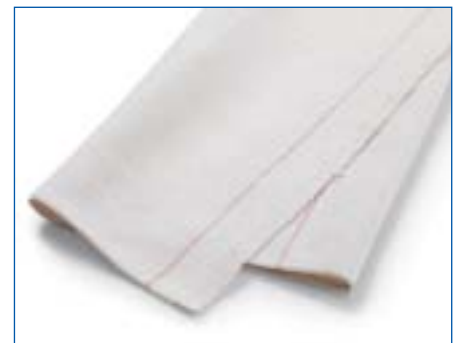
1501 Vliestuch Sperlillères Vlies renforcé 85% Baumwolle, 15% andere Fasern 85% Coton, 15% autres fibres