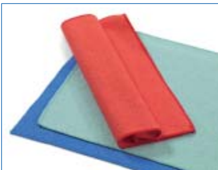
1501 Mikrofaser-tücher Chiffon microfibrés 100% Polyester