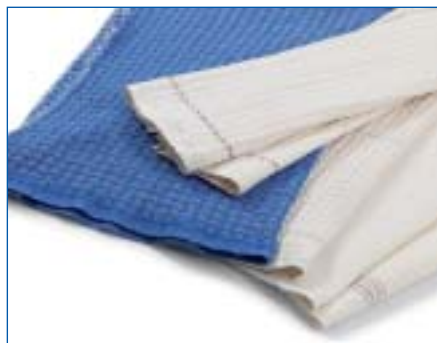
1501 Scheuertücher Serpillières 85% Baumwolle, 15% andere Fasern 85% Coton, 15% autres fibres