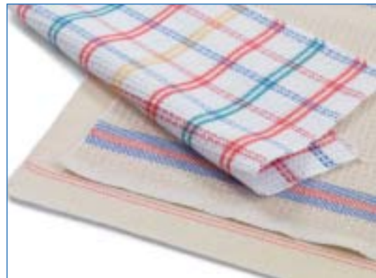
1501 Abwaschlappen Pattes à relaver 85% Baumwolle, 15% andere Fasern 85% Coton, 15% autres fibres