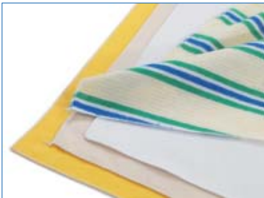
1502 Staublappen Chiffon à poussière 100% Baumwolle, 100% Coton