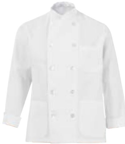
1300,0542 Kochbluse mit Polyknöpfen Veste avec boutons en nacre 100% Baumwolle | 100% Coton