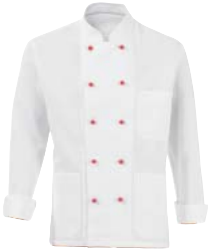
1302,0542 Kochbluse (ohne Knöpfe) Veste (sans boutons) 100% Baumwolle | 100% Coton