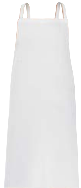
1320,0422 Latzschürze 90/100cm Tablier avec bavette 90/100cm 100% Baumwolle | 100% Coton