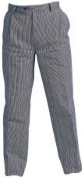
1311,0535 Kochhose H2 de Luxe Pantalon H2 de luxe 100% Baumwolle | 100% Coton