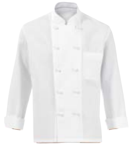
1301,0542 Kochbluse mit Stoffknöpfen Veste avec boutons en tissu 100% Baumwolle | 100% Coton