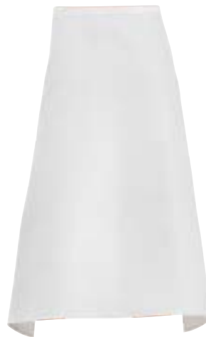
1321,0422 Halbschürze 80/80cm Demi-Tabliers 100% Baumwolle | 100% Coton