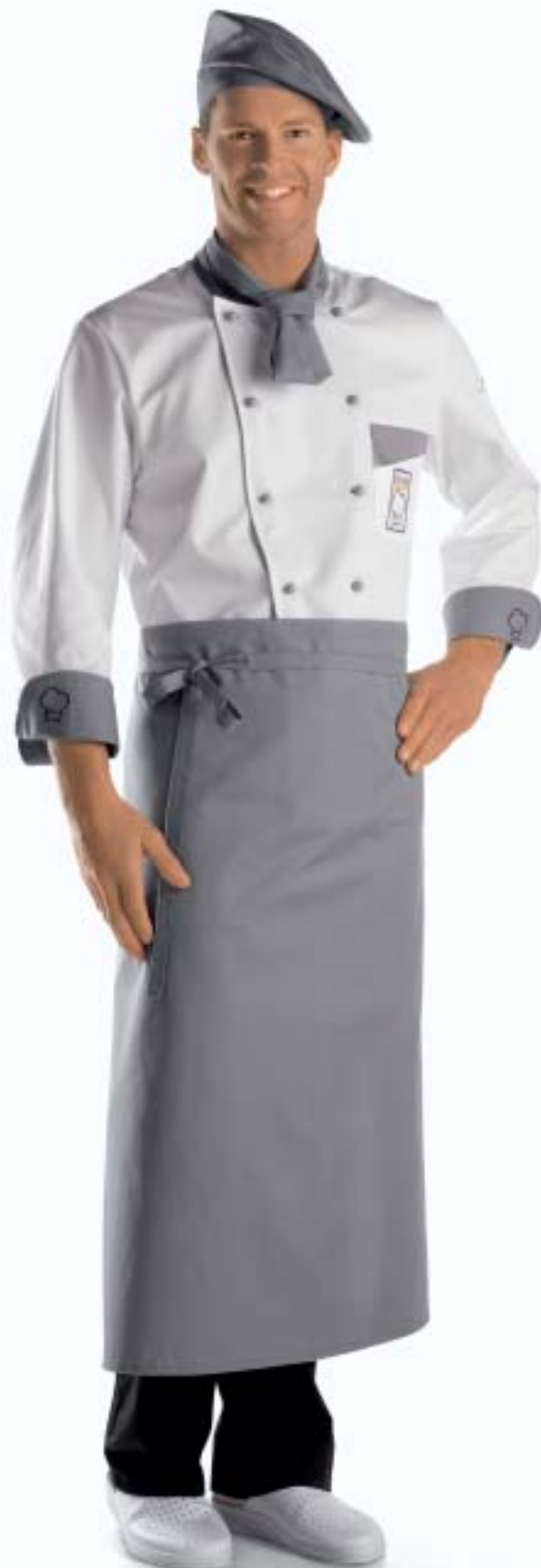
1318,0638 Kochbluse Excellence | Veste Mod. Excellence 100% Baumwolle | 100% Coton 1249,7760 Bistroschürze 90/90cm | Tablier Bistro 90/90cm 65% Polyester; 35%Baumwolle | 65% Polyester; 35% Coton