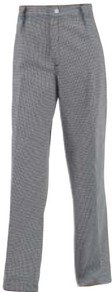
1310,0534 Kochhose Pantalon pied de poule noirs 100% Baumwolle | 100% Coton